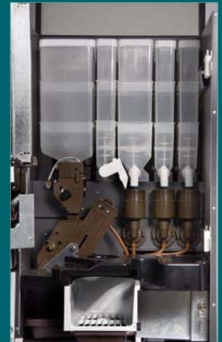
Detalle grupo de erogación y batidores.