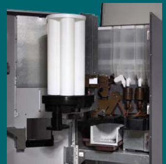
Capacidad para 250 servicios